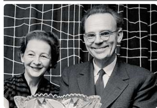
Od roku 1984 uděluje univerzita v Oslu Cenu Lisl a Lea Eitingerových

Eitingerova životní pouť začala 12. prosince 1912. Narodil se v Lomnici na Tišnovsku do početné židovské rodiny. V roce 1937 dokončil studia medicíny v Brně, o rok později se účastnil bojů na slovensko-maďarské hranici. Po návratu do Brna začal spolupracovat s norskou organizací Nansenhjelp, která působila ve střední Evropě.