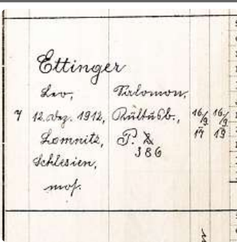
Záznam o školní docházce v Pohořelicích