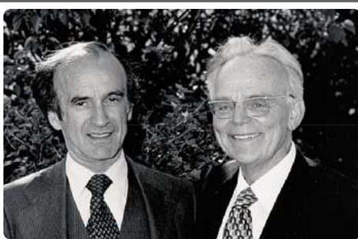
Se svým „nejslavnějším“ spolupříznivcem Eliem Wieselem Elie Wiesela se ze zdravotních důvodů nemohl zúčastnit konference v Brně, poslal však organizátorům osobní dopis s poděkováním